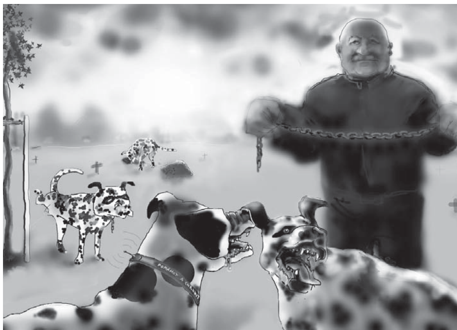
ČERNOŠICKÁ (DALMATINSKÁ) PETICE - plné znění a seznam signatářů naleznete na www.cernosicka-petice.7u.cz

Správné odpovědi hodte příští rok do volebních urn.