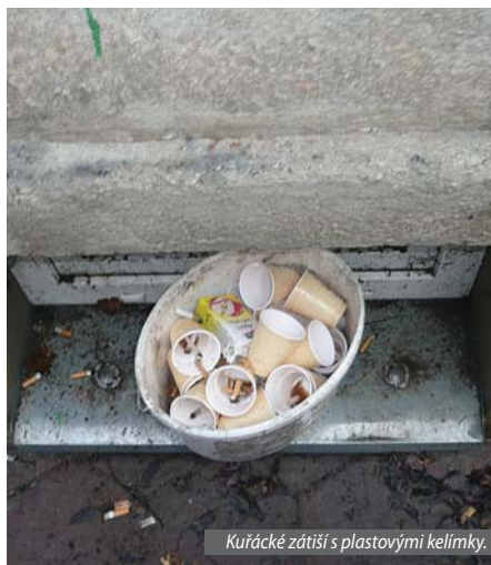
Kuřácké zátěži s plastovými kelímků.