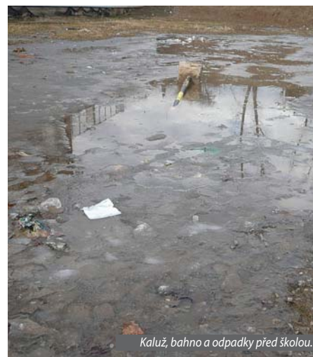
Kaluž, bahno a odpadky před školou.