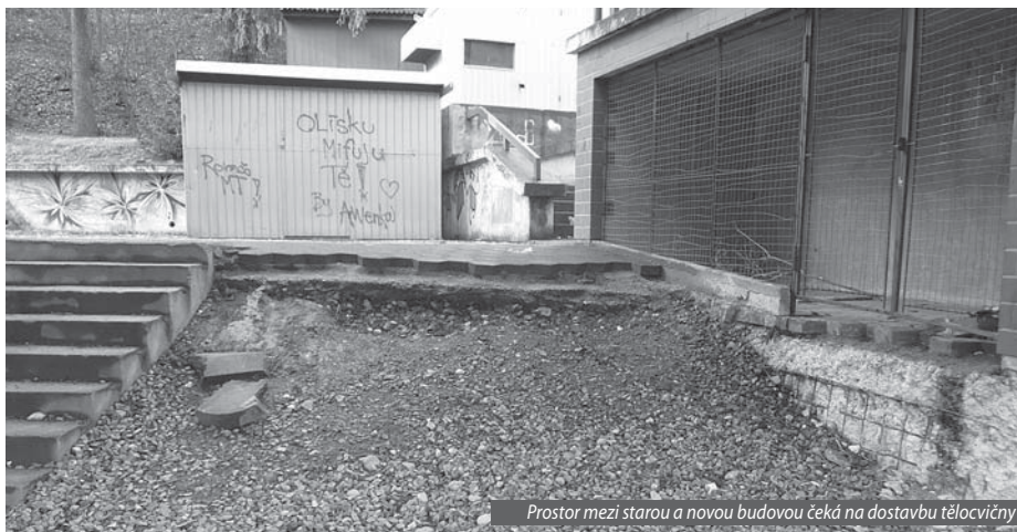
Prostor mezi starou a novou budovou čeká na dostavbu tělocvičny