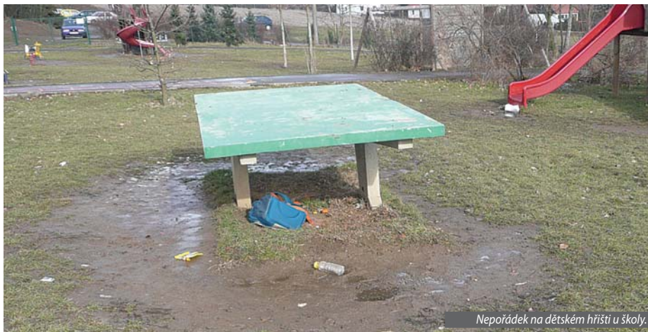
Nepořádek na dětském hřišti u školy.

několikrát převyšuje normu pro jednoho školníka. Jako zastupitelka bych se sice mohla odmítnout popsanou situaci zabývat se slovy, že škola je samostatný subjekt a jako takový by si měl s těmito problémy v rámci svého rozpočtu poradit. Ale do školy chodí naše černošické děti a já nechci, aby si zvykaly na to, že nepořádek je normální .