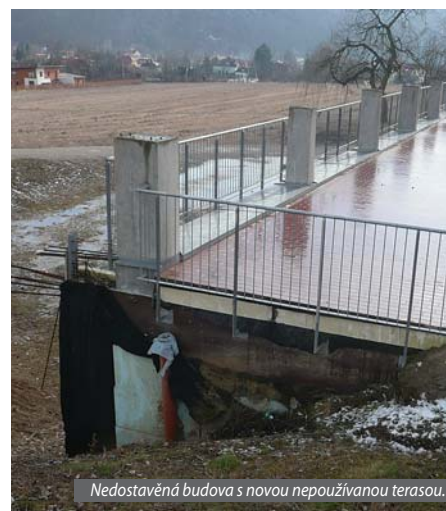
Nedostavěná budova s novou nepoužívanou terasou.

Vedení školy o většině uvedených problémů ví a některé se řešit snaží. Je však limitováno nejen finančními, ale i technickými možnostmi, které má k dispozici. Ředitel školy musí zajišťovat pro-