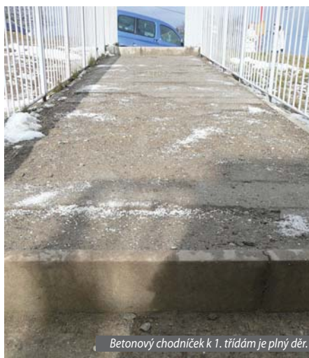
Betonový chodníček k 1. třídám je plný děr.

Nepořádek okolo školy je nepřehlédnutelný a trvalý. Některé odpadky setrvávají na svých místech i několik týdnů. Počet cigaretových oharků na metr čtverečný před budovou prvňáčků je odpuzující. Za školou je neuhrazené listí, kyblík plný plastových kelímků a vajglů, vedle nafukovací haly leží několik týdnů jakási dosti odporná plachta, hřiště u školy