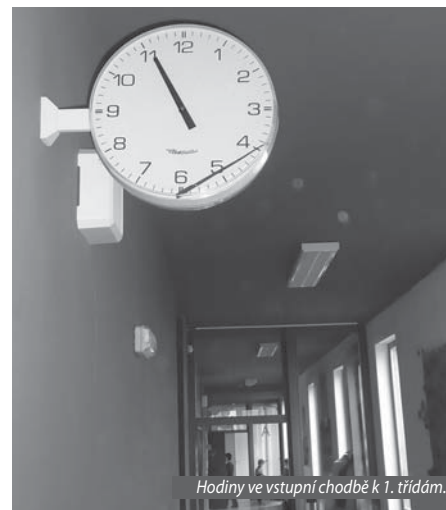
Hodiny ve vstupní chodbě k 1. třídám.

musí požádat některou z družinářek či učitelek (které mají v tu chvíli na starosti dvě desítky dětí) o odemčení dveří.