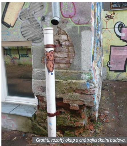
Graffiti, rozbitý okap a chátrající školní budova.