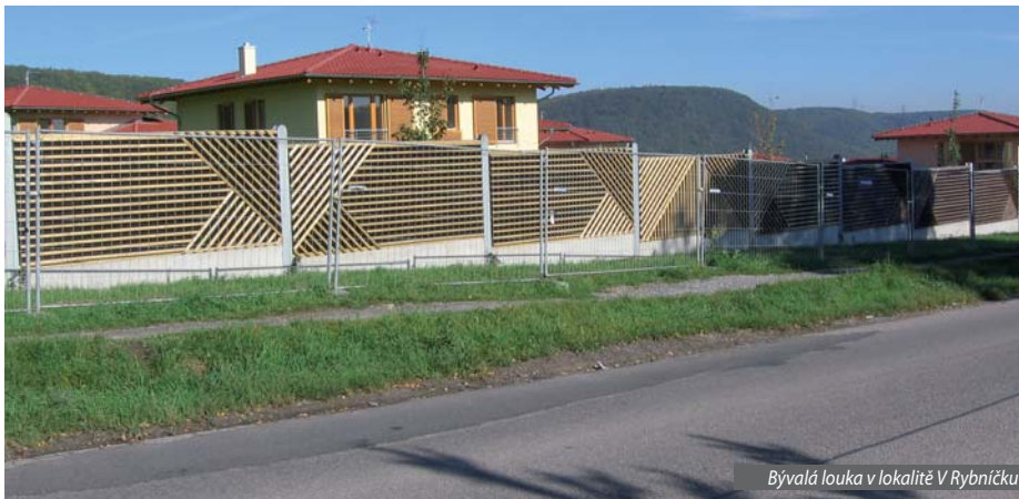
Bývalá louka v lokalitě V Rybníčku