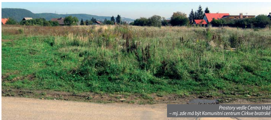
Prostory vedle Centra Vráž – mj. zde má být Komunitní centrum Církve bratrské

pomýlená až manipulativní argumentace. Nebo snad postavit na letenské pláni rodinné domky by pro Pražany bylo přínosem?