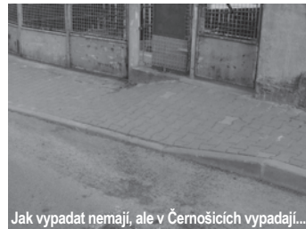
Jak vypadat nemají, ale v Černošicích vypadají...