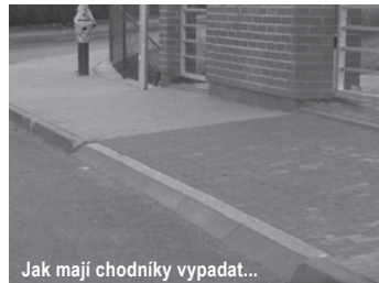
Jak mají chodníky vypadat...