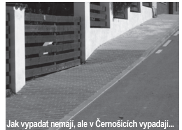
Jak vypadat nemají, ale v Černošicích vypadají...