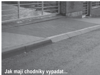
Jak mají chodníky vypadat...