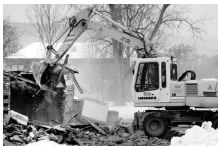
2010 - demolice