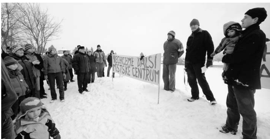
Fotografie z občanského happeningu v sobotu 13.2. u Základní školy; více informací také na www.pozemekpodskolou.cz

Z původně zveřejněné studie městského centra (Informační list 3/2009) bylo možné odhadnout, že plocha budoucího městského centra by měla činit cca 14,5 tis. m 2 , z čehož město již 4 500 m 2 vlastní. Z toho jsme dovozovali, že zbývajících cca 10 tis. m 2 by město dostalo darem. Na oplátku by se zvětšila plocha určená pro rezidenční výstavbu ze stávajících cca 15 tis. m 2 na cca 22,2 tis. m 2 . S vědomím možných nepřesností vzniklých hrubým měřením ploch jsme parametry takového obchodu považovali za celkem rozumné: ačkoliv město umožní re-