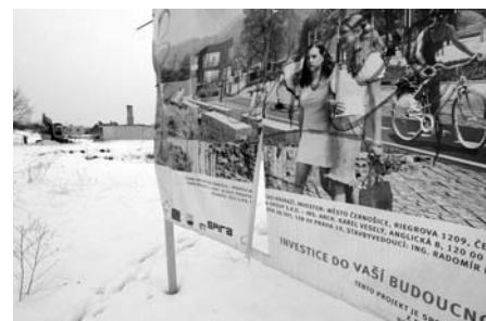
Propagační billboard projektu